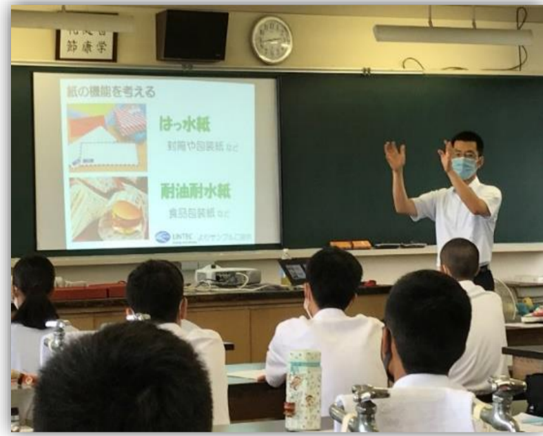
愛媛大学紙産業 イノベーションセンター